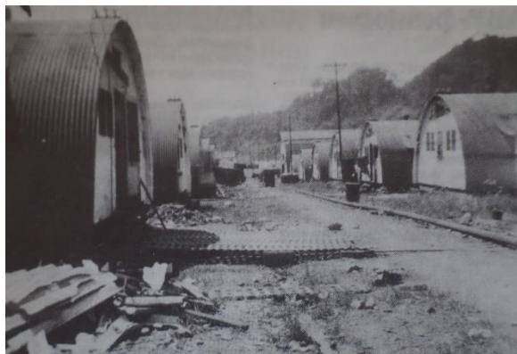
Legerkamp bij Hollandia bij aankomst van 43 AAT op 25 december 1949.

Een van de eenheden uit deze tussenperiode die ik even wil uitlichten was een AAT-eenheid die al enige tijd in Nederlands-Indië aanwezig was. B-peloton van de 43 Compagnie Aan en Afvoer Troepen vertrok in december 1949 naar Hollandia (aan de noordoostkust). 19 Ze werden hier als ondersteuning van het 434 Bataljon Infanterie dat naar Nieuw-Guinea gestuurd was om de daar aanwezige troepen te versterken tijdens de soevereiniteitsoverdracht van de rest van Nederlands-Indië. Officieel waren de taken ordehandhaving en het tegengaan van Indonesische infiltraties. Het 43 AAT was verantwoordelijk voor transportondersteuning, zowel door troepentransport voor bijvoorbeeld patrouilles als door