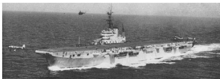
De Hr. Ms. Karel Doorman in 1955.

Onderdeel van deze versterkingen was ook een van de meest unieke zeetochten in de geschiedenis van de Nederlandse vloot. Op 30 mei 1960 vertrok vanuit Rotterdam Nederlands grootste marineschip ooit en haar tweede en laatste vliegdekschip, de Hr. Ms. Karel Doorman, voor de lange reis naar Nieuw-Guinea. Het schip werd vergezeld door twee torpedobootjagers en een tanker, tezamen vormde de schepen het