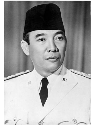
President Soekarno van Indonesië

Indonesische nationalisten in hoog tempo de deelstaten van de Verenigde Staten van Indonesië. 7 In augustus 1950 werd vervolgens de Republiek Indonesië uitgeroepen. Dit was in tegenstelling tot de eerdere Verenigde Staten een eenheidsstaat. In september werd vervolgens ook de Republiek der Zuid-Molukken binnengevallen. Deze republiek was opgericht in de Molukken in reactie op de centralisatiepogingen van Soekarno. De Molukkers wilden geen onderdeel zijn van een Indonesische staat. Soekarno en de Indonesische nationalist wilde duidelijk een eenheidsstaat die de hele voormalige kolonie omvatte. Deze ontwikkelingen, samen met de slechte behandeling van Nederlanders in Indonesië, zorgde voor een verslechtering van de verhoudingen tussen Indonesië en Nederland. Hierdoor kwamen onderhandelingen over de status van Nederlands-Nieuw-Guinea ook tot stilstand. In Nederland was geen enkele meerderheid te vinden voor een overdracht aan Indonesië. De internationale druk op Nederland was begin jaren '50 ook minder. Dit kwam mede omdat Indonesië weigerde een kant te kiezen in de Koude Oorlog. Daarom wilde Australië Nederlands-Nieuw-Guinea graag behouden als bufferzone tussen hen en een mogelijk communistisch Indonesië en waren ook de Amerikanen meer geneigd zich afzijdig te houden. 8