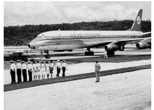
Eerste DC-8 op vliegveld Mokmer, op Biak.

Transport werd dus zowel door de krijgsmacht zelf uitgevoerd als door particuliere bedrijven. Luchttransport werd zoals gezegd voornamelijk door KLM verzorgd. Zeetransport van goederen werd meestal uitgevoerd door particuliere rederijen zoals de Stoomvaart Maatschappij Nederland. Goederen van essentiële en gevoelige militaire aard zoals munitie werden wel door de krijgsmacht zelf gedaan. Individuen of kleinere groepen personeel vlogen vaak naar Nieuw-Guinea, in sommige gevallen (zoals tijdens verlof) kon er zelfs privé gereisd worden. Als grote groepen militairen naar Nieuw-Guinea gingen, zoals bijvoorbeeld tijdens de versterkingen in 1960, organiseerde de krijgsmacht de reis, dit ging dan per schip vanuit Nederland. 36