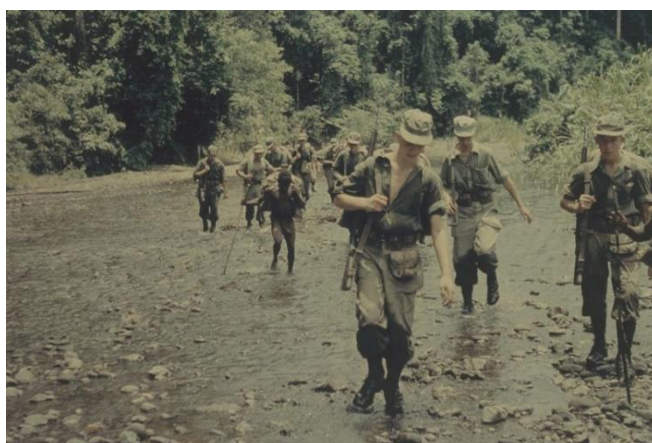
Op patrouille in Nederlands-Nieuw-Guinea

Dit betekent dat er extra transportmogelijkheden gecreëerd moesten worden. Hiervoor waren een paar opties. Als de patrouille langs een rivier ging dan was het mogelijk om goederen via prauwen te vervoeren. Dit was verreweg de makkelijkste en goedkoopste optie, maar dus wel erg afhankelijk van de aanwezigheid van water. Lastdieren waren geen reële optie op een grote schaal, er waren geen inheemse dieren op Nieuw-Guinea. Elk beest zou dus van elders gehaald moeten worden en zich dan aanpassen aan een klimaat en land waaraan het niet gewend was. Daarnaast moest men voor lastdieren ook voedsel meenemen, waardoor weer extra lastdieren nodig waren enzovoort. De laatste optie waren lokale dragers. Dit was de manier waarop de inheemse bevolking de spullen vervoerde, door het te dragen. Deze konden ook door de Nederlandse krijgsmacht ingehuurd worden. Hier zaten echter ook wel nadelen aan. In de eerste plaats de hoge kosten van het inhuren