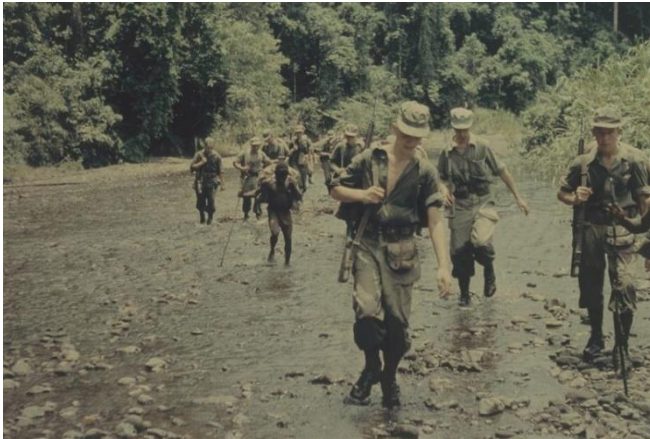
Op patrouille in Nederlands-Nieuw-Guinea

Met name de logistieke ondersteuning van patrouilles te voet vormde een geweldige uitdaging. De inheemse bevolking kon leven van de jungle. Voor de Nederlandse militairen was dat geen optie. V.w.b. levensmiddelen was men dus afhankelijk van houdbare levensmiddelen. De inzet van lastdieren was door de zeer beperkte aanwezigheid van dergelijke dieren vrijwel onmogelijk. Inhuren van lokale dragers was niet alleen duur, maar ook deze personen moesten weer gevoed worden. Om een patrouille gedurende twee weken te kunnen inzetten waren er per militair ca. 4 ingehuurde lokale