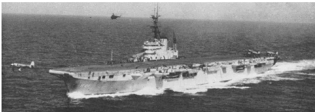
De Hr. Ms. Karel Doorman in 1955.

Een van de meest unieke zeetochten in de geschiedenis van de Nederlandse vloot maakte deel uit van deze versterkingen. Op 30 mei 1960 vertrok vanuit Rotterdam Nederlands grootste marineschip ooit en haar tweede en laatste vliegdekschip, de Hr. Ms. Karel Doorman, voor de lange reis naar Nederlands-Nieuw-Guinea. Het schip werd vergezeld