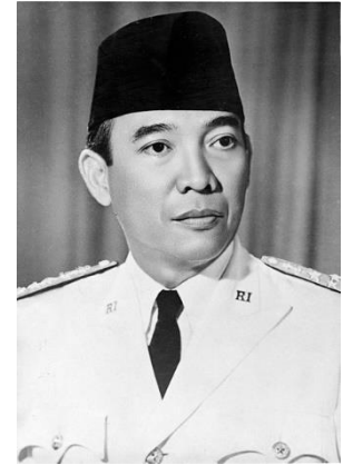
President Soekarno van Indonesië

Terwijl de onderhandelingen over Nederlands-Nieuw-Guinea stagneerden, begon Nederland met het opbouwen van een nieuw bestuur op het eiland. Vanaf midden jaren '50 begon de focus van dit bestuur zich meer en meer te richten op zelfbestuur. Dit was ook een belangrijk onderdeel van de justificatie van Nederland voor het bezit van het eiland. Het Nederlandse gezag zou de lokale bevolking opleiden zodat zij zichzelf kon gaan besturen als onafhankelijk land of mogelijk samen zou kunnen gaan met het Australische deel van het eiland. De controle over het oostelijke deel van het eiland was na de Eerste Wereldoorlog overgegaan op Australië. Dit was ook de reden dat Indonesië geen recht zou hebben op het gebied. Volgens het zelfbeschikkingsrecht mocht een volk zelf beslissen over hoe het