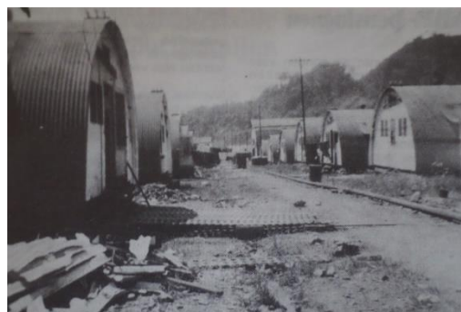
Legerkamp bij Hollandia bij aankomst van 43 AAT op 25 december 1949.

Een van de eenheden uit deze tussenperiode die moet worden uitgelicht, betreft een AAT-eenheid die al enige tijd in Nederlands-Indië aanwezig was. Het B-peloton van de 43 Compagnie Aan en Afvoer Troepen vertrok in december 1949 naar Hollandia (aan de noordoostkust). 19