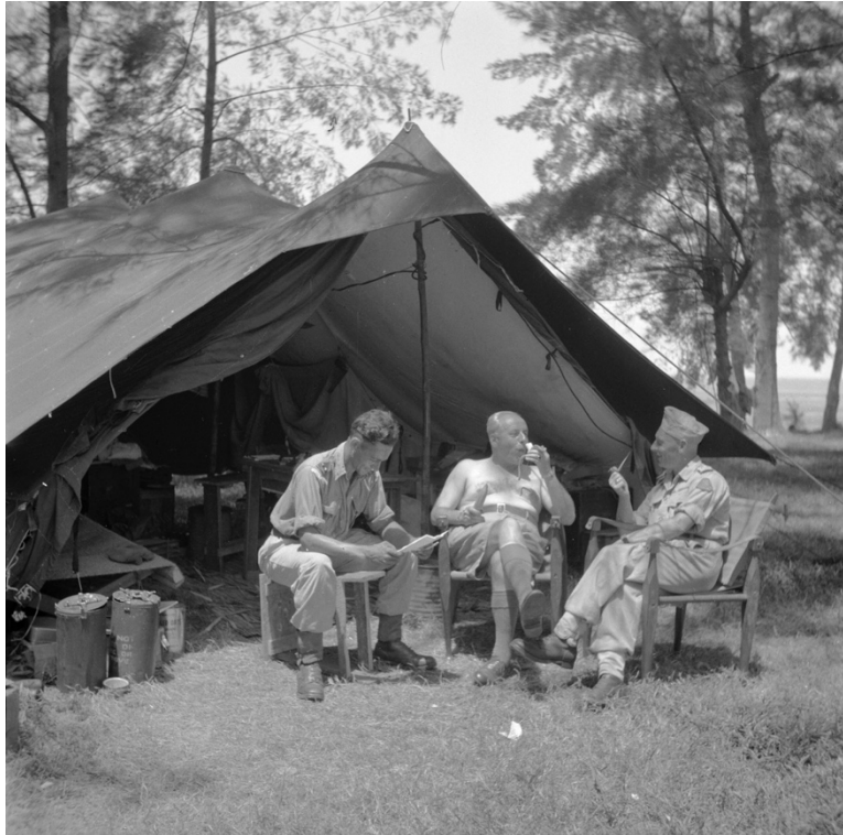
Officieren bij bivak op Java 1946

overnachten in een tent of op een kampong. 32 De voorzieningen die hiervoor nodig zijn, kunnen er anders uitzien dan militairen tijdens legering te velde in Nederland gewend zijn. Vanwege de hitte in Nederlands-Indië zijn kachels en dekens een stuk minder noodzakelijk dan op Nederlands grondgebied. Zoals op onderstaande foto's te zien is, is het opzetten van een veldbed onder een afdak op de kampong voor veel militairen al voldoende. Officieren hebben hun eigen bivak dat wat betreft slapen, bestaat uit een veldbed in een relatief ruime tent.