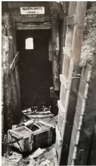
Stelling in de Tweede Wereldoorlog, Het Leger Boek

bijkomende hygiëne in bijna elk van deze legeringsgebouwen afwezig. Doordat de leiding probeert zo veel mogelijk militairen in een gebouw onder te brengen, slapen de soldaten zeer dicht op elkaar. Om de verspreiding van ziektes te voorkomen, plaatst men op sommige plaatsen later soms houten schotten tussen de hoofdeindes. 22 Echter, net als het geval is voor dekens