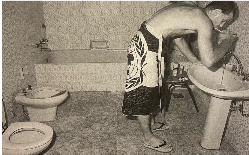
Sanitaire voorzieningen in vaste infrastructuur in Libanon, Blauwe baretten tussen twee vuren in Libanon

verschil met oefening in Duitsland is dat in Libanon de infanterist op een veldbed mag slapen. De inzet van kachels is door de Libanese temperaturen minder nodig. Bad- en wasvoorzieningen kunnen mogelijk worden gemaakt door mobiele installaties. Militairen van staven en logistieke eenheden zijn vaak dichterbij de bewoonde wereld gelegerd. Soldaten slapen hier zowel in zgn. prefabs als in huizen die