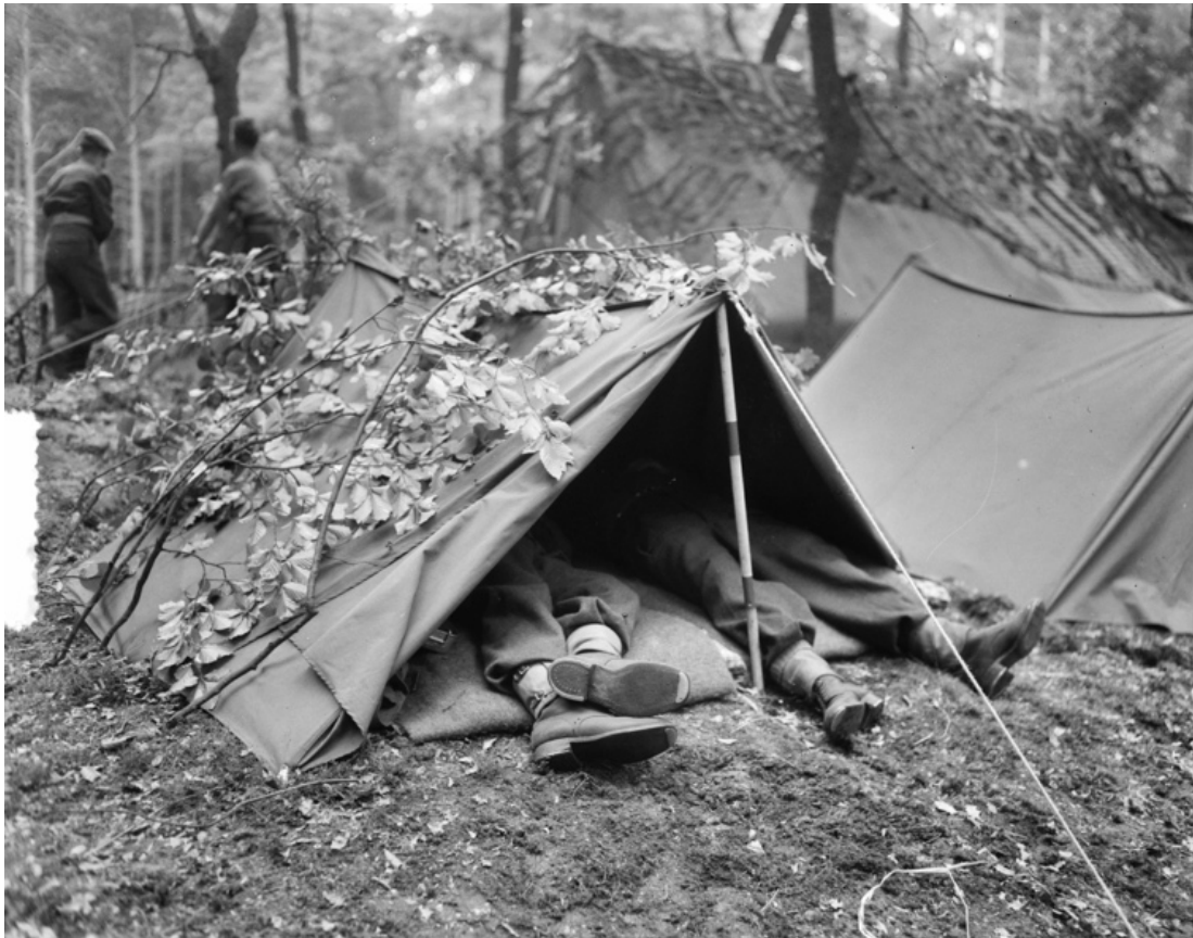
Tweepersoonstenten tijdens oefening 'Grand Repulse' in Duitsland 1953

uitrusting. 55 De sanitaire behoefte moet de militair ter plekke doen. Om de verspreiding van ziektes zo veel mogelijk te voorkomen, graaft men een gat in de grond dat naderhand weer opnieuw wordt afgedekt met zand. 56