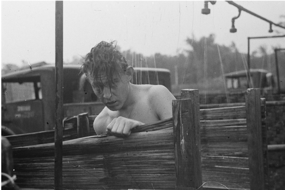
Militair neemt een douche in openlucht douche-installatie op Java 1948

af. Prioriteit voor bevoorrading van goederen ligt onder die omstandigheden vooral bij munitie en voeding, minder of niet bij goederen voor wassen en baden. Daarnaast lijkt de individuele soldaat juist dan het belang van sanitaire voorzieningen uit het oog te verliezen. 40 Zoals eerder vermeld hebben veel militairen die richting Nederlands-Indië vertrekken maar een beperkte voorbereiding gehad. De discipline ten aanzien van persoonlijke verzorging maakt daarom vaak ook nog geen vast deel uit van de noodzakelijke vaardigheden.