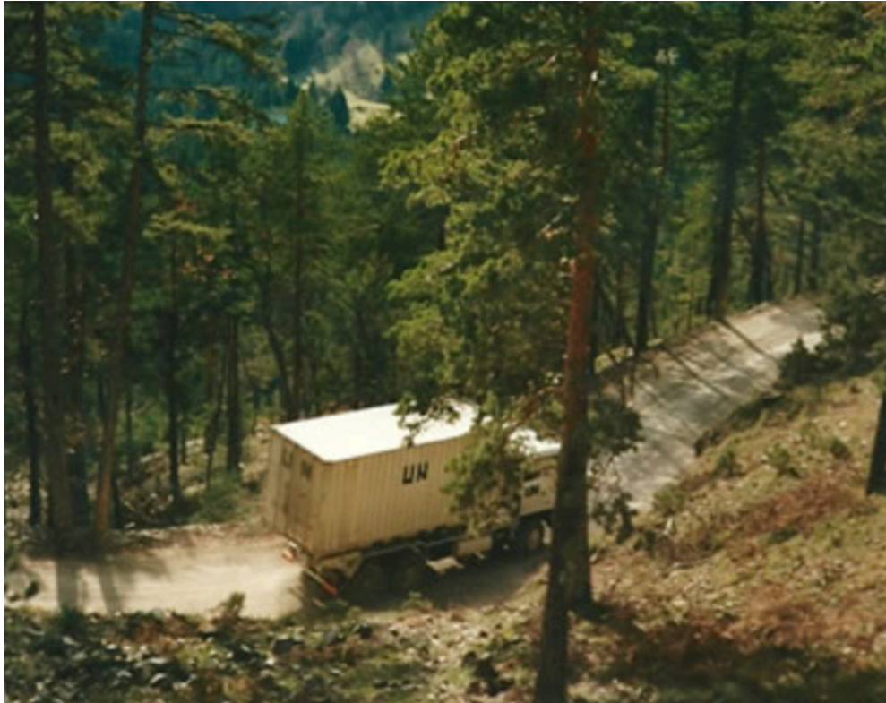
Transport van Support Command in Bosnië waarin ook geslapen kon worden, 1(NL) Support Command