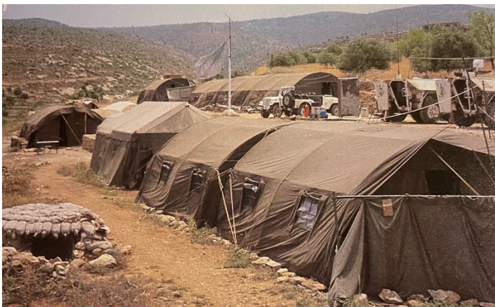
Tentenkamp Nederlandse eenheden in Libanon, Blauwe baretten tussen twee vuren in Libanon

Na de inzet van de Koninklijke Landmacht in Nederlands-Indië is het aantal overzeese missies van Nederlandse eenheden vrij beperkt. Hoewel Nederland wel een stand-by positie heeft om de Verenigde Naties (VN) tijdens humanitaire missies bij te staan, wordt hier nauwelijks een beroep op gedaan. 75 Pas in 1978 krijgt Nederland het verzoek om het hiervoor geormerkte VN-bataljon (44 Pantserinfanteriebataljon) in te zetten voor een vredesmissie in Libanon. Interne spanningen en een inval vanuit Israël in Zuid-Libanon zorgen voor gewelddadige situaties. 76 In 1979 vertrekt een bataljon onder de naam Dutchbat richting Libanon, waar het tot 1983 zal blijven. Vanaf dat moment wordt de missie voorgezet door een kleinere eenheid: Dutchcoy. 77 De taken van Dutchbat bestaan in het begin