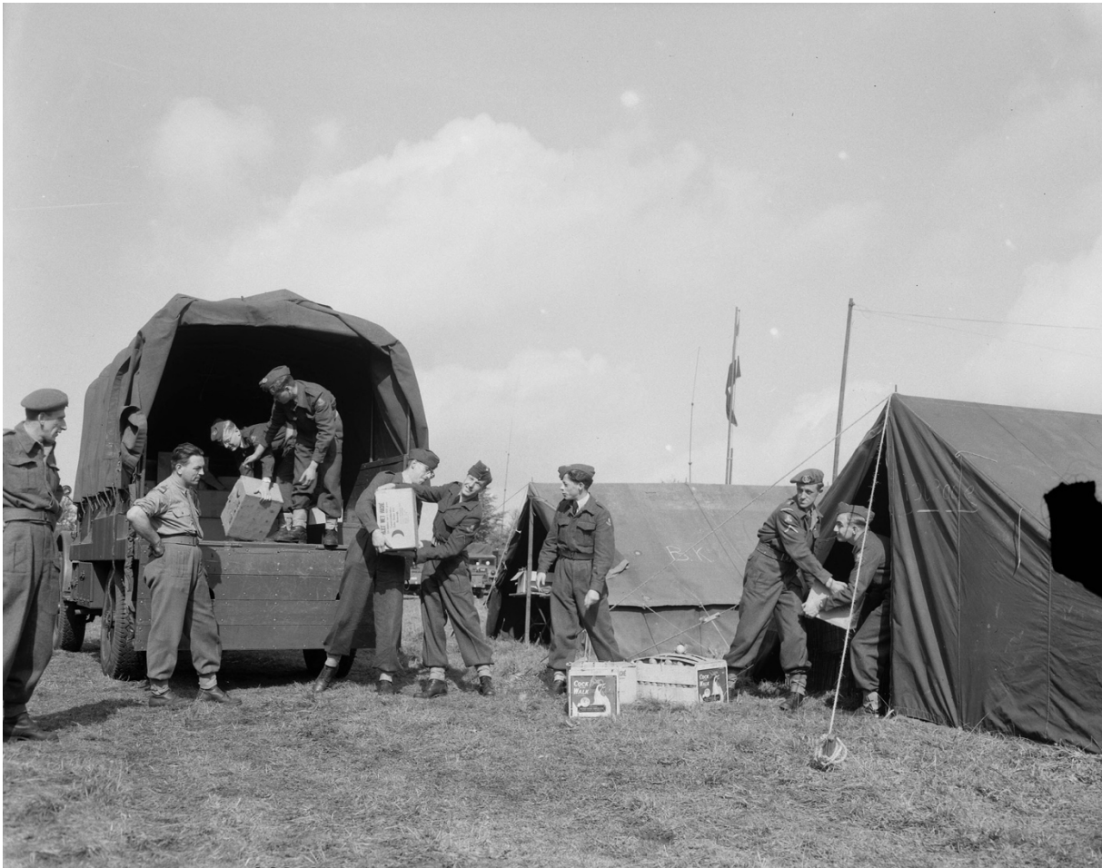
Tentenkamp tijdens oefening 'Grand Repulse' in Duitsland 1953

mogelijk wanneer de tactische omstandigheden en het bijbehorende dreigingsniveau dit toelaten. 61 Als door een eenheid zo'n legeringsgebied te velde moet worden opgezet, wordt met een groot aantal factoren rekening gehouden, zoals onder meer de ondergrond, de toegang tot drinkwater, de mogelijkheden tot camouflage en of het goed toegankelijk is voor eigen verkeer. 62