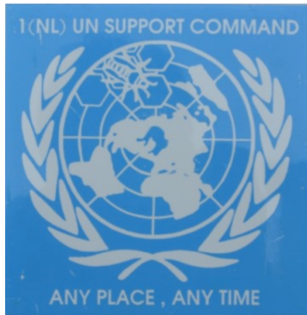
Onderdeelsembleem 1(NL) UN Support Command,

Tijdens de Nederlandse inzet in voormalig Joegoslavië tussen 1992 en 1995 nemen verschillende logistieke eenheden deel aan deze uitzending. Het eerst aanwezige (maar niet-logistieke) bataljon is het 1(NL)VN Verbindingsbataljon, vanaf maart 1992 tot april 1994. Dit bataljon zorgt, verspreid over het hele gebied, voor de communicatie tussen alle binnen UNPROFOR ( United Nations Protection Force ) ingezette bataljons (van de diverse troepen leverende naties). 98 Vanaf begin 1993 wordt ook 1(NL/BE)VN Transportbataljon ingezet in Joegoslavië. De hoofdtaak van dit bataljon is het uitvoeren van humanitaire hulpkonvoeien voor de lokale bevolking. Dit doen ze met name in en tussen het Bosnische Busovaca en Santici en het Kroatische Split. 99 De bij het Nederlandse publiek meest bekende eenheid is het infanteriebataljon genaamd Dutchbat, dat van 1994 tot de val van Srebrenica in 1995 in Bosnië gevestigd is. Onder dit Dutchbat valt ook de logistieke eenheid genaamd Support Command . De militairen van Support Command hebben als een van de voornaamste taken het uitvoeren van bevoorradingsritten van en naar de eenheden van Dutchbat, die onder meer locaties heeft in Simin Han, Tuzla en Srebrenica. Vanaf april 1995 vallen het Transportbataljon en Support Command samen onder 1(NL/BE)VN Logistieke- en Transportbataljon, waardoor de taken in elkaar vloeien. 100