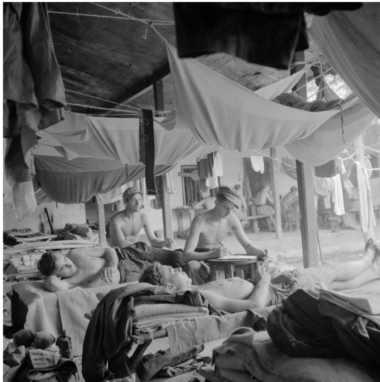
Verblijf vrijwillige militairen op Java 1946

aangekomen in Nederlands-Indië. 35 Overigens zijn klamboes pas effectief als deze in goede staat zijn en blijven en op de juiste manier worden gebruikt. Het is lang niet altijd goed gesteld met de klamboe-discipline. Malaria-uitbraken zijn dan ook geen uitzondering en hebben een grote uitputtingslag voor het lichaam en de geest tot gevolg van de ziek geworden militairen. 36