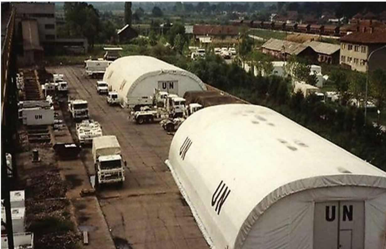
Boogtenten van de Verenigde Naties in Bosnië-Herzegovina, 1(NL) Support Command